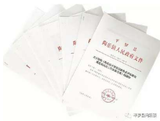
图 1-2 各项政务公开文件

5号)、《关于印发陶乐镇2017年政务公开工作要点的通知》(陶政发〔2017〕80号)、《关于印发陶乐镇全面推进政务公开若干重点工作实施方案的通知》(陶政发〔2017〕93号)、《陶乐镇人民政府关于进一步规范政府信息公开依申请公开工作的通知》(陶政发〔2017〕101号)、《关于调整平罗县陶乐镇政务公开工作领导小组及政务公开监督小组的通知》(陶政发〔2017〕109号)、《关于印发陶乐镇开展基层政务公开标准化规范化试点工作实施方案》(陶政发〔2017〕189号)等政务公开文件;根据《平罗县政务公开工作手册》要求,严格执行《陶乐镇人民政府关于印发陶乐镇政府信息公开制度(修订版)等七项制度的通知》(陶政发〔2017〕156号)、网站运行制度、公文标识属性制度等相关制度,积极推进我镇政务公开的全面落实工作。明确工作职责,由党政办负责全镇的政府信息公开工作,指定专人分别负责在平罗县人民政府网与微信公众号的信息更新,并由专人负责跟踪与陶乐镇有关的网络舆情及时与县网信办联系进行疏导澄清,同时负责从“两微”及时回复网友咨询。