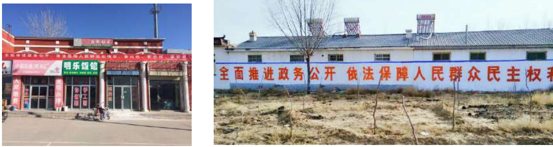
图 1-4 政务公开宣传