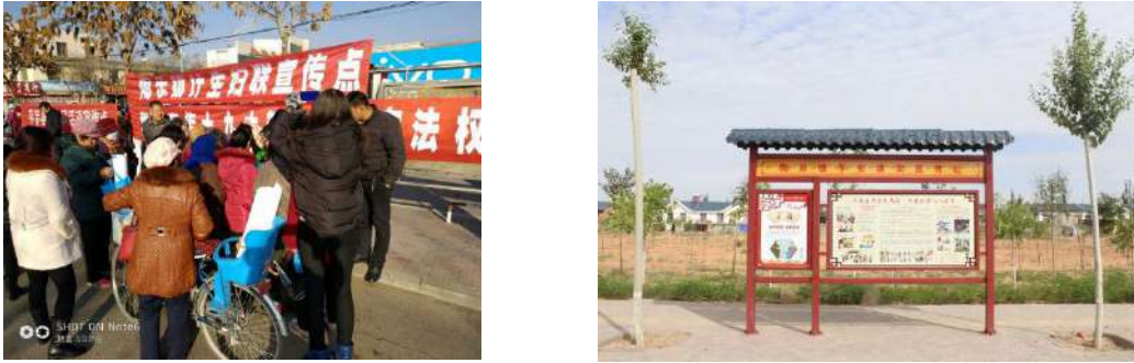
图 5 政策宣传

党委书记及分管领导在干部例会上集中对干部进行政策讲解，干部在下村入户及平时生活中将政策及时带入群众家中。