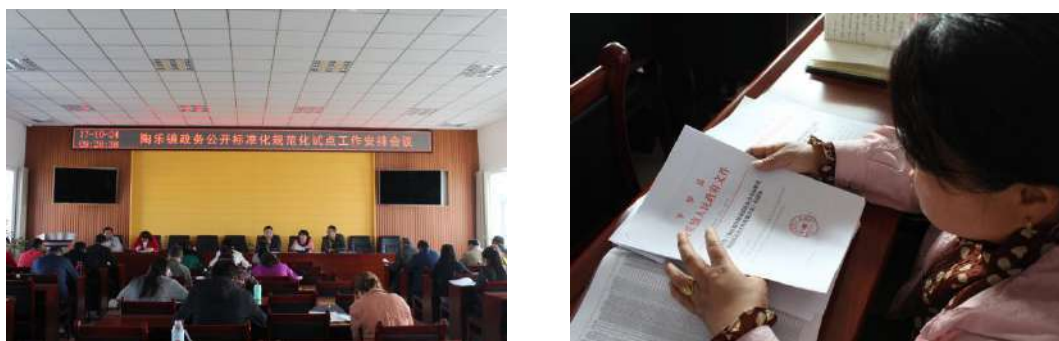
图 1-3 工作推进

程、网站的使用进行培训，从而提高办事效率。并于 12 月 21 日对各村（居）、站所 2017 年政务公开工作进行了考核。