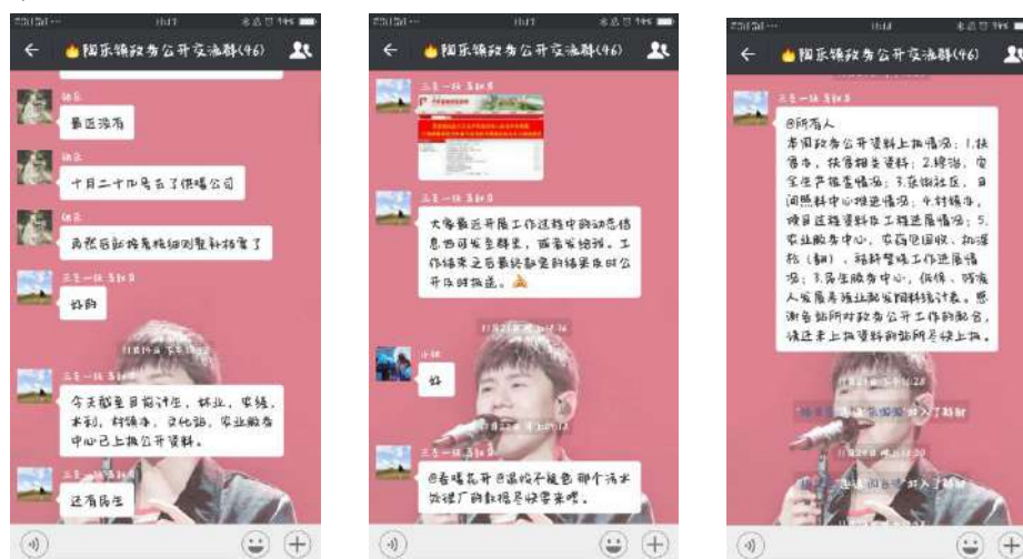
图 1-1 微信群交流截图

镇党委、政府按照“谁公开，谁负责”的原则，从强化组织领导入手，狠抓了政务公开组织体系的建设。根据人员变动及时调整了陶乐镇政务公开领导小组，由镇长任组长，人大主席、分管领导为副组长，各站所所长为成员，下设办公室在党政办，由专人负责政务公开工作；调整政务公开监督小组，由组织委员任组长，各村（居）书记为成员。各村、居都成立了村务、居务公开领导小组，形成了镇、村、居齐抓共管，遍及各领域、各行业的政务公开组织体系，为政务公开工作的顺利开展提供了强有力的组织保证。组建“陶乐镇政务公开交流”微信群，群成员为主要领导、分管领导、村（居）书记、站所长及联络员。随时在群里发布消息，并对上报公开材料情况进行通报，通过领导监督，站所互学，全力营造我镇政务公开浓厚氛围。