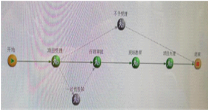
优化前后办理流程

服务公开，对水利行政审批 21 项（含子项）服务事项内容所需资料通过政府网站、办事手册宣传卡片等方式有效公开，提升实体政务大厅服务能力，依托水慧通平台，简化政务服务